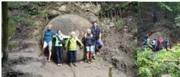
17 Uhr Rückfahrt ins Hotel - Freier Abend